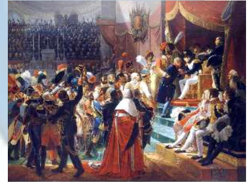
14 juillet 1804 aux Invalides

En 1802, la Légion d'Honneur est créée le 19 Mai, par Bonaparte, 1 er Consul, pour récompenser les vertus et services civils et militaires.