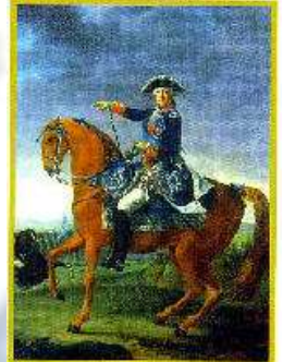
Chevalier portant les insignes de Saint Louis et du Saint Esprit