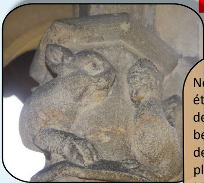
Un chapiteau du couvent des Cordeliers