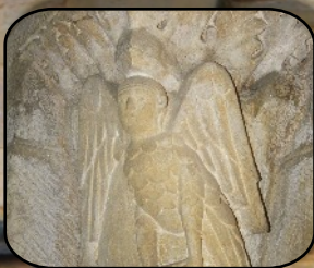
Un chapiteau de l'abbaye Bénédictine

Après avoir parcouru la vallée de l'Azergues, où se côtoient la rivière, la route et la voie ferrée, et franchi le col des Echarmeaux avec la première neige de la saison, nous avons visité le couvent des Cordeliers, sous la conduite experte d'une guide érudite et spontanée. Nous avons repris des forces autour d'une table avec un excellent repas. La dégustation de l'omelette norvégienne flambée a parfaitement clos le repas au son d'un orgue de Barbarie.