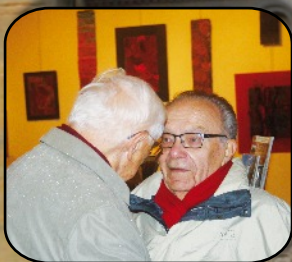
Dialogue entre deux présidents