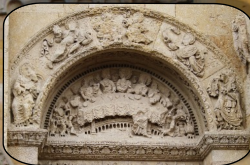
Les noces de Cana