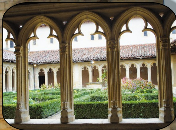
Le cloître de l'abbaye Bénédictine

L'après-midi fut consacrée à la visite, toujours commentée par notre excellente guide, de l'abbaye Bénédictine. Nous avons pu admirer le narthex, pur chef-d'œuvre de l'art roman du XIIe siècle, le cloître gothique et bien d'autres joyaux beaucoup trop nombreux pour être listés. Le retour à Lyon s'est fait dans de très bonnes conditions.