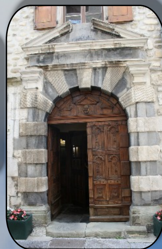
La belle porte de la mairie de Serres