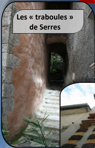
Les « traboules » de Serres

Notre premier arrêt se fait à Serres la moyenâgeuse