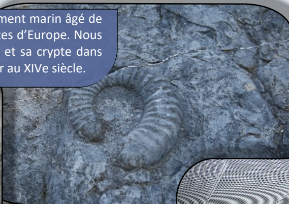
Notre Président observe une ammonite