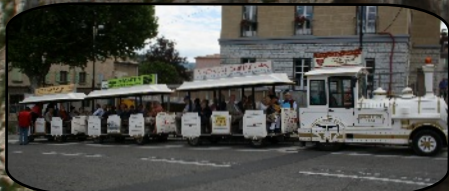
La citadelle de Sisteron un panorama époustoufflant

Après un déjeuner à Sisteron, nous visitons " en petit train " la vieille ville, nous montons à l'assaut de la citadelle et découvrons son double panorama historique et géologique sur le Dauphiné et la Provence.