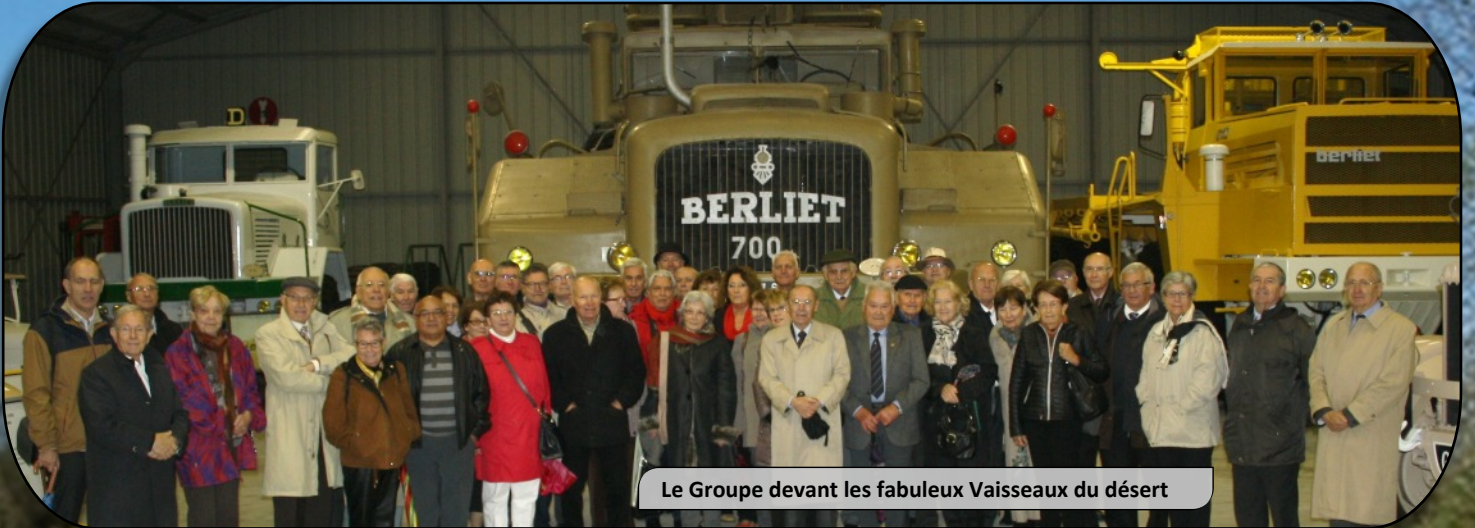
Le Groupe devant les fabuleux Vaisseaux du désert

Puis vint le temps du recueillement avec le dépôt de gerbe au monument aux morts du village du Montellier tout proche.