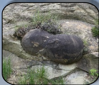
Boules de grès

Après un bon repas, nous avons pu contempler les grès à boules de Saint-André-de-Rosans, phénomène géologique ex- traordinaire, et visiter le prieuré clunisien du XIIe siècle de mê- me nom. Nous nous sommes émerveillés devant sa mosaïque et les paysages alentours.