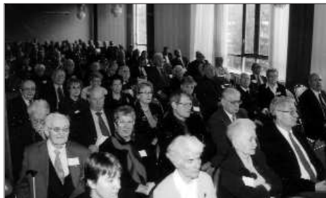
La salle est comble