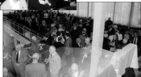
La mezzanine aussi ..