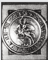
3 ème Hussards

En 1920, il se marie et est affecté dans les garnisons de cavalerie suivantes : Arles, Gray 5 ème dragon, Rambouillet 4 ème Hussards, puis en 1936, il rejoint, avec le 3 ème Hussards, Wissembourg.