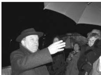
Sur le pont, dans la froidure

La Vorgine prend son élan, nous décollons du quai, quelques encablures sur le Rhône, demi-tour impeccable puis direction la Mulatière nous remontons la Saône, le courant est fort, notre embarcation ralentit, et stoppe... la hauteur du cours a imposé une régulation pour la circulation des bateaux, la Saône est mise en sens unique : chacun son tour avec des horaires bien définis. Nous devons stagner une grosse heure pour qu'à 21 heures nous puissions enfin franchir le feu enfin vert et nous diriger vers les « lumières ».