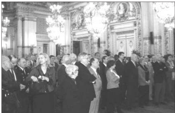
Une assistance nombreuse.