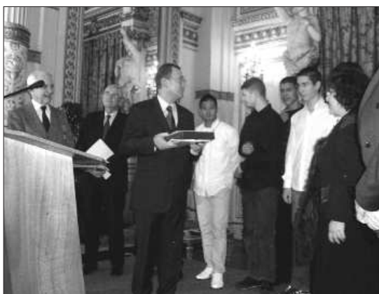
Remise des prix.

Les 2 ème et 3 ème prix récompensent les élèves de 3 ème du collège Georges Charpak de Brindas , et du lycée professionnel La Sauvagère de Lyon 9 ème . Enfin, 3 accessits sont attribués à égalité, à la Fédération du Rhône des Familles de France , au collège des Servizières de Meyzieu , et au collège de Bellecombe de Lyon 6 ème .