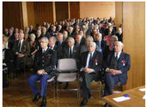
...devant une assistance nombreuse et attentive